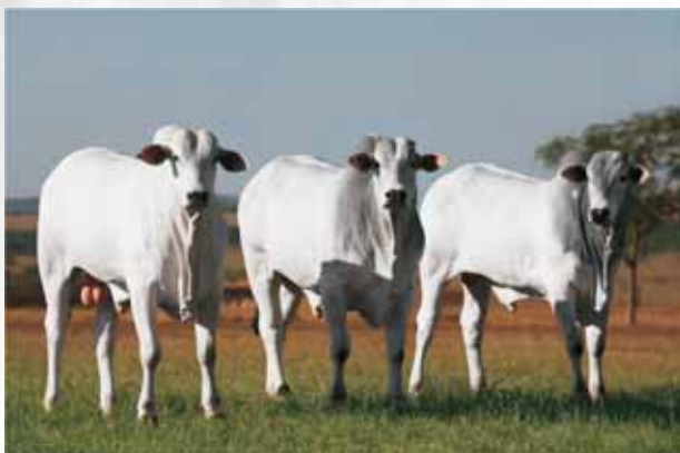
Peso 680 kg aos 23 meses