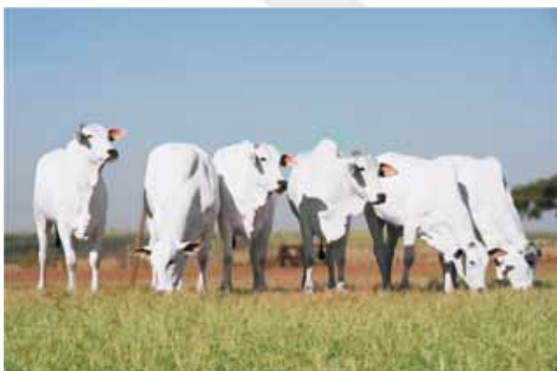
Peso 520 kg aos 22 meses