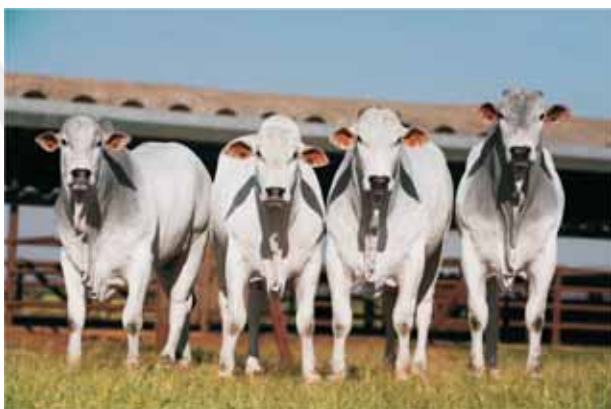
Peso 680 kg aos 23 meses