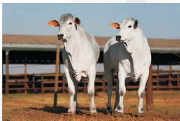
Peso 390 kg aos 11 meses