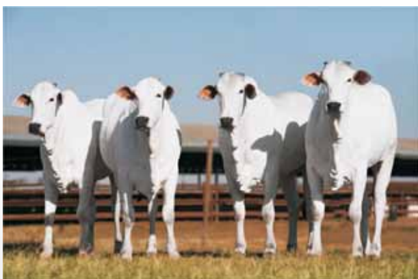
Peso 520 kg aos 22 meses